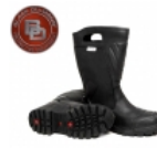
Bota NFPA Black Diamond X-Boot