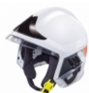
Casco Rescate Gallet F1 XF MSA