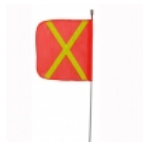
Antena pertiga 8 pies