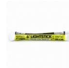
Barra Fluorescente Northern Light

Lamina de alta duraci3n y gran visibilidad para aplicar en senales de trãnsito, camiones, camionetas, transporte escolar, vehi•culos comerciales, carros de arrastre, remolques, buses y otros vehi•culos u otros usos seguridad del trãfico.