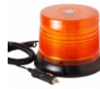
Baliza ambar LED WL49