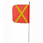
Antena pertiga 8 pies

Lámina de alta duración y gran visibilidad para aplicar en señales de tránsito, camiones, camionetas, transporte escolar, vehículos comerciales, carros de arrastre, remolques, buses y otros vehículos u otros usos seguridad del tráfico.