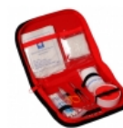
Botiquin Vehicular DH- 6018