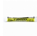
Barra Fluorescente Northern Light

Lámina de alta duración y gran visibilidad para aplicar en señales de tránsito, camiones, camionetas, transporte escolar, vehículos comerciales, carros de arrastre, remolques, buses y otros vehículos u otros usos seguridad del tráfico.