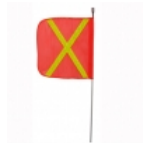
Antena pertiga 8 pies