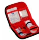
Botiquin Vehicular DH- 6018