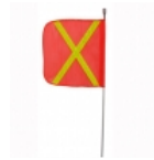
Antena pertiga 8 pies

Lámina de alta duración y gran visibilidad para aplicar en señales de tránsito, camiones, camionetas, transporte escolar, vehículos comerciales, carros de arrastre, remolques, buses y otros vehículos u otros usos seguridad del tráfico.