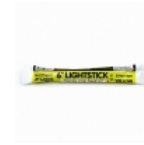
Barra Fluorescente Northern Light

Lamina de alta duraci3n y gran visibilidad para aplicar en senales de trafico, camiones, camionetas, transporte escolar, vehiculos comerciales, carros de arrastre, remolques, buses y otros vehiculos u otros usos seguridad del trafico.