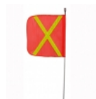
Antena pertiga 8 pies

Lámina de alta duración y gran visibilidad para aplicar en señales de tránsito, camiones, camionetas, transporte escolar, vehículos comerciales, carros de arrastre, remolques, buses y otros vehículos u otros usos seguridad del tráfico.