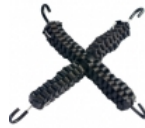
Tensor de cadena