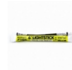
Barra Fluorescente Northern Light

Lamina de alta duraci3n y gran visibilidad para aplicar en senales de trañnsito, camiones, camionetas, transporte escolar, vehiñculos comerciales, carros de arrastre, remolques, buses y otros vehiñculos u otros usos seguridad del trañfico.